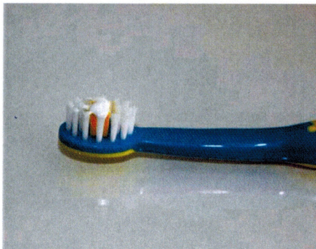
Abb. A: Dünner Film an Kinderzahncreme

Dosierungsempfehlungen für die Zahncremeanwendung bei Kindern: Die gefärbten Büschel des Bürstenkopfes geben eine Orientierung; links Dosierung bis zum zweiten Geburtstag, rechts Dosierung bis zum 6. Geburtstag.